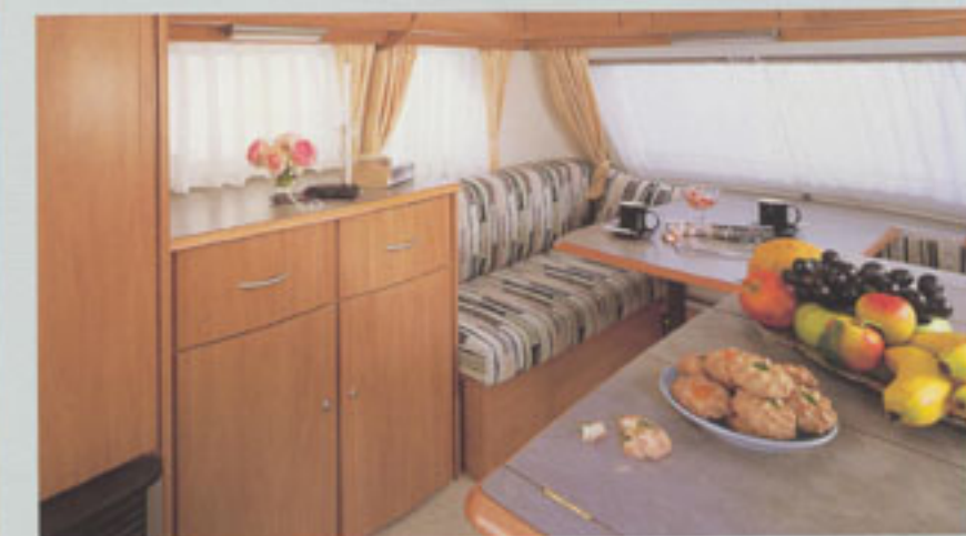
Funktionale Küche im Eriba-Future 430 T und eine gemütliche Hecksitzgruppe im Eriba- Future 480 Z, jeweils in der Stoffkombination Toronto. Unten die Bugsitzgruppe im Eriba-Future 430 S in der textilen Ausstattung Casablanca.